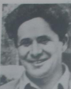
Nikos Zachariadis 1903-1975 1938 Nikos Zachariadis war als 1933 Generalsekretär der kommunistischen Partei Griechenlands (KKE) und wurde 1938 von der griechischen Regierung verhaftet. Bei dem Gefangenenaustausch im Jahr 1941 wurde er ins KZ Dachau verschleppt. Hier war er bis zur Befreiung 1945 inhaftiert. Am 25. Mai 1945 wurde er nach Griechenland zurückgeführt und wurde die Führung der KKE. Nach der Flucht der Kommunisten in Bulgarien, 1948 ging er nach Moskau. Auf Intervention der KKE wurde er im Jahre 1954 als Generalsekretär ernannt und er starb am 20. Februar 1975 in Athen.

Of the more than 1,000 Greeks who were imprisoned in Dachau, the majority were arrested on suspicion of working in the resistance movement. Until summer 1943 the German occupying forces generally murdered such suspects, but as a result of labor shortages, they were now increasingly deported to Germany to do forced labor. Since mid-1944, hundreds of Jewish Greeks arrived from the Auschwitz concentration camp to the Mühldorf and Kaufering subcamps. They were forced to build large bunkers under murderous working and living conditions.